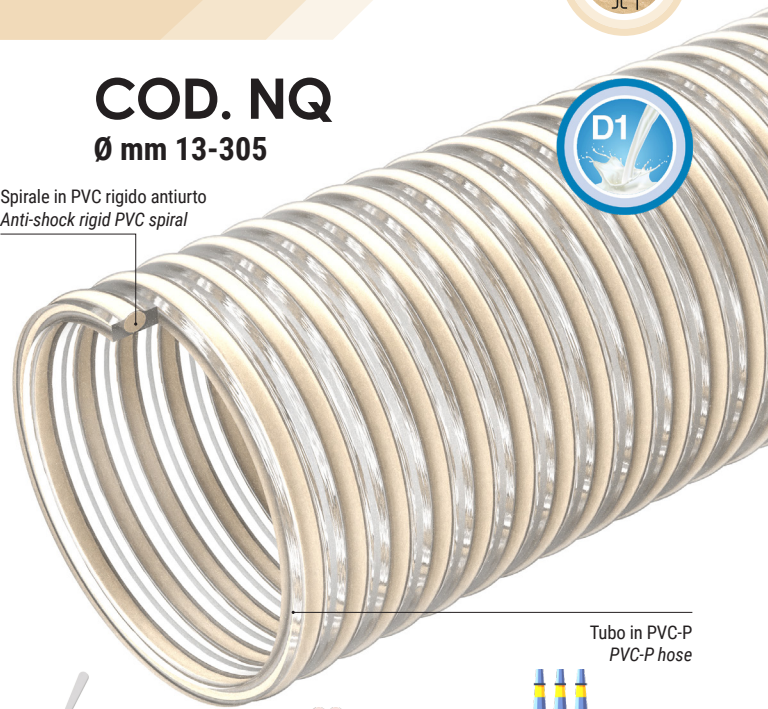
Tubo in PVC-P PVC-P hose