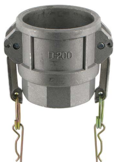
*-G with NBR Thread Gasket

Camlock tipo D: versione femmina filettato femmina BSPP - Guarnizione NBR (*guarnizione piatta con guarnizione del filo NBR)