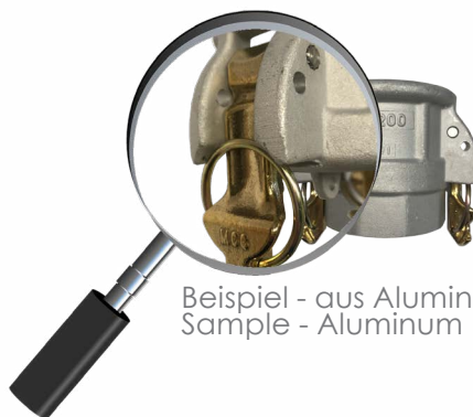
Beispiel - aus Aluminium Sample - Aluminum