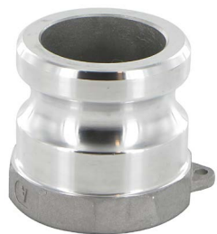
*-G with NBR Thread Gasket

Camlock tipo A: versione maschio filettato femmina BSPP (*guarnizione piatta con guarnizione del filo NBR)